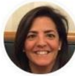
Presidenta de la Asociación