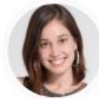
Área de Comunicación