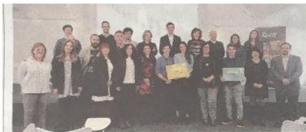
Finalistas y ganadores de los premios, ayer en CEIN.

La Asociación ha sido seleccionada para participar en el programa de Impulso al Emprendedor del Centro Europeo de Innovación Navarra ( CEIN ) y participa en el concurso Iníciate 2018 de la misma entidad pero no lo ganamos. Ha sido una oportunidad enriquecedora ante un jurado compuesto por empresas y organismos de Navarra a los que le llega nuestro proyecto.