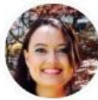
Área de Finanzas