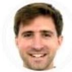
Área de Tecnología